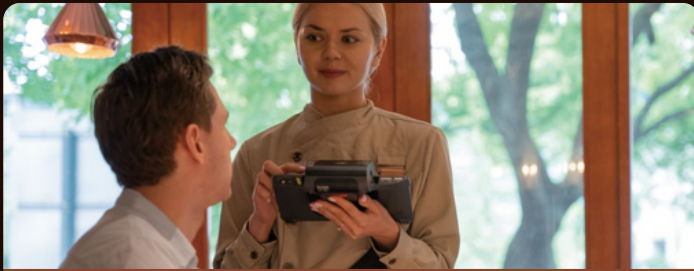
Ordinazione al tavolo