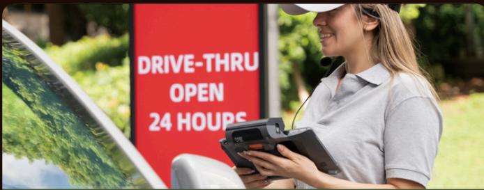
Percorribile in auto