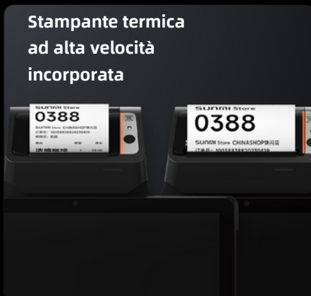
Stampante termica ad alta velocità incorporata