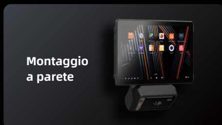
Montaggio a parete