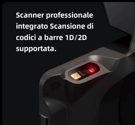
Scanner professionale integrato Scansione di codici a barre 1D/2D supportata.